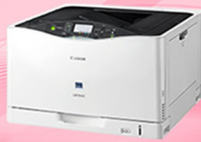
A3カラーレーザープリンター LBP841CS