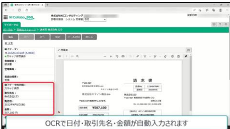
⑤OCRで必要事項を自動認識。読取箇所が間違っていた場合は修正が必要ですが、AIが学習してくれるので、どんどん精度がUPします