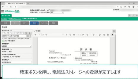
⑥確定ボタンを押すと可変できない状態（電帳法の必須条件）で登録完了