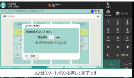
④複合機の【スタート】ボタンを押してスキャン開始