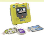
旭化成 ZOLL AED3 (安心パック付)