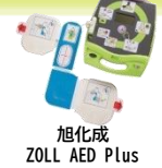
旭化成 ZOLL AED Plus (安心パック付)