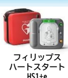
フィリップス ハートスタート HS1+e