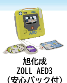
旭化成 ZOLL AED3 (安心パック付)