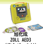
旭化成 ZOLL AED3 (安心パック付)