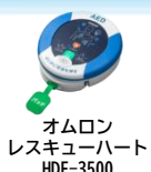
オムロン レスキューハート HDF-3500