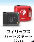
フィリップス ハートスタート FRx+e