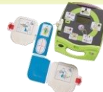
旭化成 ZOLL AED Plus (安心パック付)

AEDは救命処置のための医療機器です。AEDを設置したら、いつでも使用できるように、AEDのインジケータや消耗品の有効期限などを日頃から点検することが重要です。製造販売業者または販売業者が、設置者の保守管理の手間を軽減する独自のサービスをご用意しております。お客様のご都合に合わせて、これらを利用し、いつでもAEDが使える状態にしておいてください。