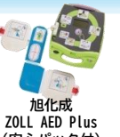
旭化成 ZOLL AED Plus (安心パック付)