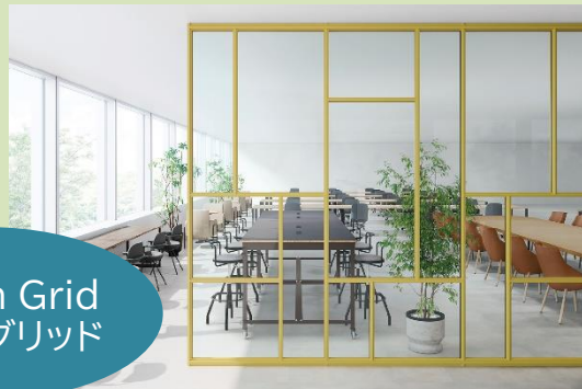
Random Grid ランダムグリッド