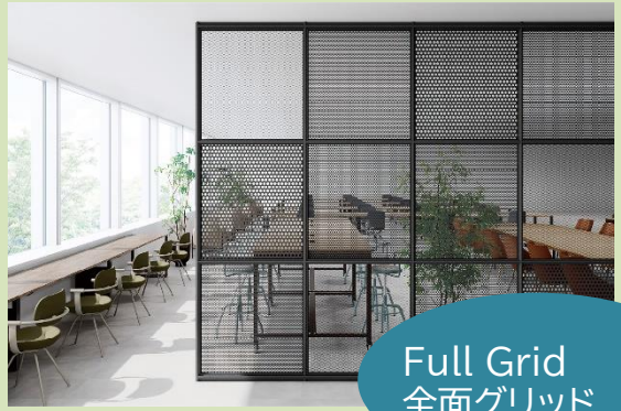
Full Grid 全面グリッド