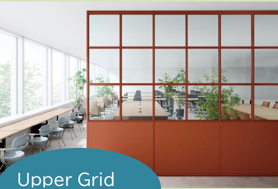
Upper Grid 腰上グリッド

多様なフレームスタイル・パネルパターン・カラーを自由に組み合わせることで、自分たちらしい空間を作ることができるパーティション common furniture(コモンファニチャー)